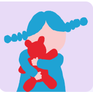
Maryam, 5 jaar Geen Wlz

Welke kinderen kunnen in de praktijk wel zorg uit de Wlz krijgen en welke kinderen niet? Dit zijn een paar voorbeelden. De namen en situaties zijn niet echt. Elk kind is anders, dus de situatie van uw kind wordt goed onderzocht.